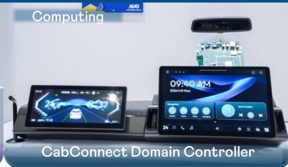
CabConnect Domain Controller