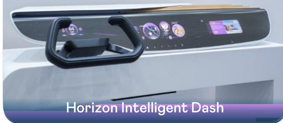
Horizon Intelligent Dash