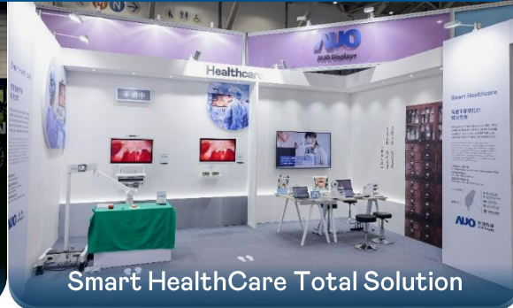
Smart HealthCare Total Solution